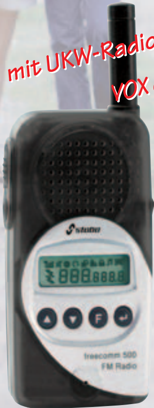
Art.Nr. 20227 schwarz